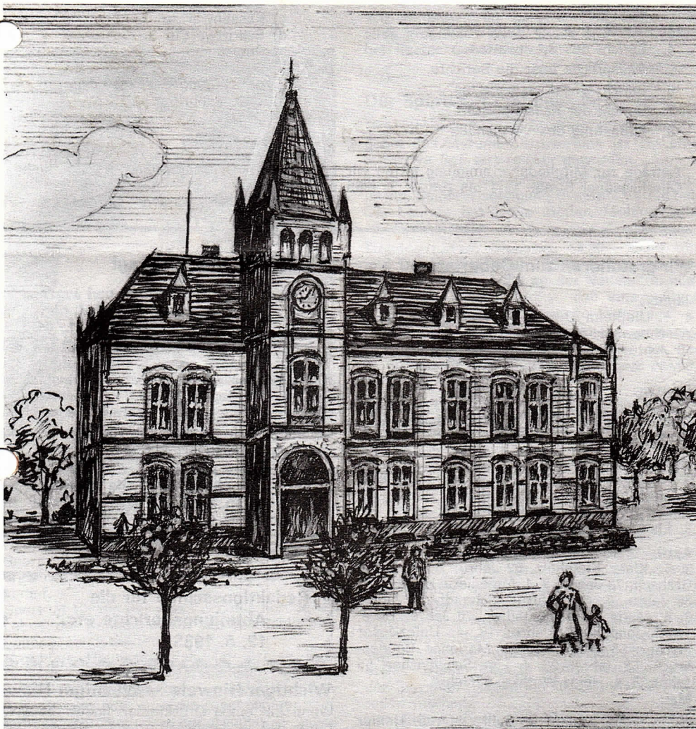
Styrumer Rathaus, erbaut 1898

Nach einer Zeichnung von Heinrich Ruthmann